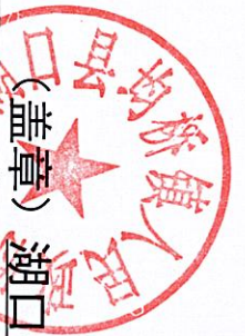
(盖章) 湖口县均桥镇人民政府 (政府、部门) 2024年度行政处罚实施情况统计表