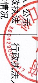
湖口县均桥镇人民政府（政府、部门）2024年度行政执法总体情况统计表